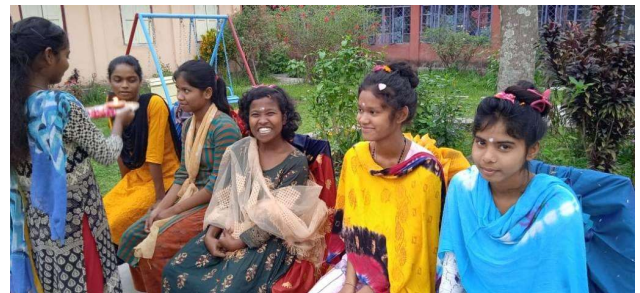
Les filles de Bakuabari qui ont fini l'école et quittent HSP

Les installations solaires de Mogradanghi et de Don Bosco SERI ont produit cette année et nous avons ici la production. La production de courant solaire de l'installation photovoltaïque de 5kW de Mogradanghi est au total de 5'946 kWh sur toute l'année 2022. Voici la production mensuelle dans le diagramme ci-dessous